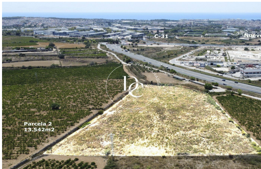
Parcela 2 13.542m 2