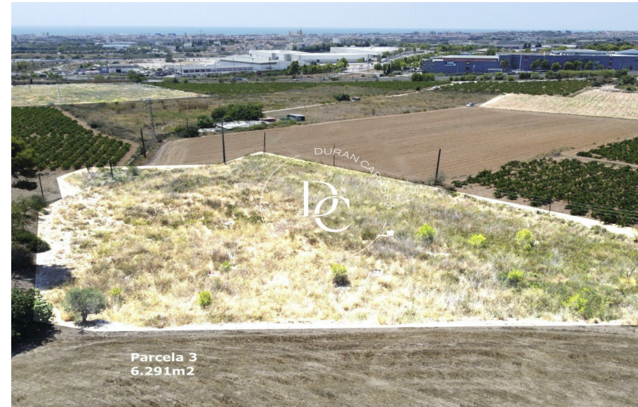
Parcela 3 6.291m 2